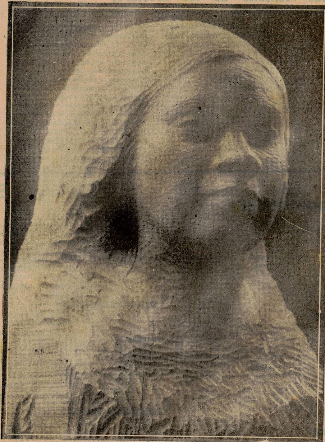
CRIOLLA.—Escultura en madera.